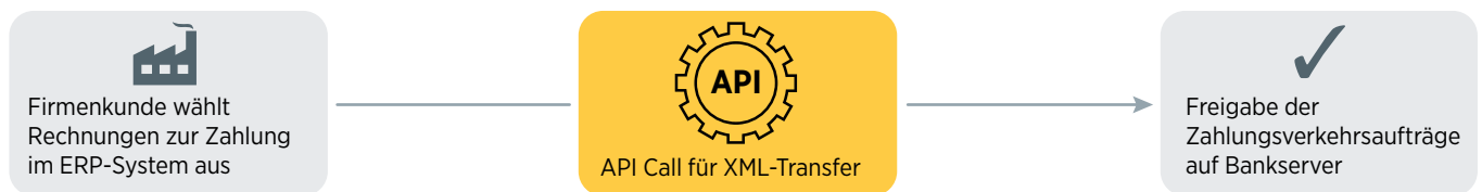
Abbildung zeigt beispielhaft den Teilprozess „Zahlungsauftrag einreichen“.